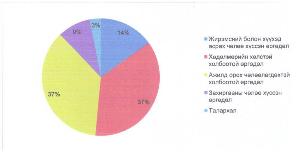
График 2. Өргөдлийг төрлөөр нь ангилсан байдал

Графикаас харвал 2024 оны нэгдүгээр улиралд ирсэн нийт өргөдлийн ихэнх хувийг буюу 37 хувийг хөдөлмөрийн хөлс, ажилд орох, ажлаас чөлөөлөгдөхтэй холбоотой өргөдөл эзэлж байна.