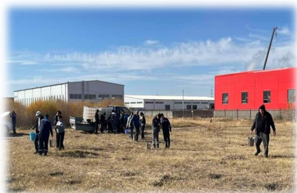
Зураг 1. Модны арчилгаа, усалгаа хийх явцаас