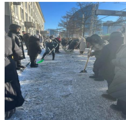
Зураг 1. Төв шуудангийн урд хэсэг