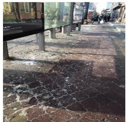
Зураг 4. Мөнгөн завьяа автобусны буудал