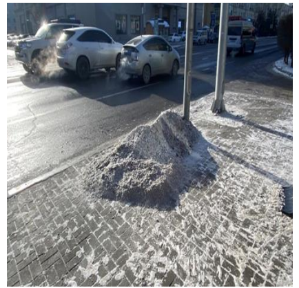
Зураг 2. Автобусны буудал