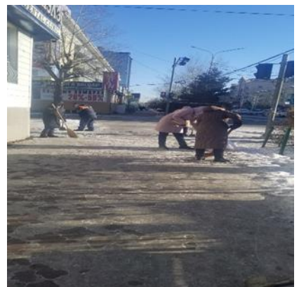
Зураг 5. Баруун дөрвөн зам хүртэлх