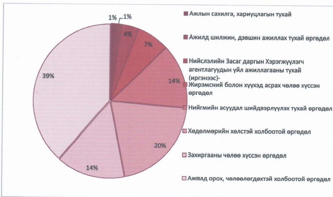
График 1. Өргөдлийг төрлөөр нь ангилсан байдал.

Өргөдөл гомдлын төрлийг нийт өргөдөлд эзэлж буй хувиар нь үзүүлбэл: