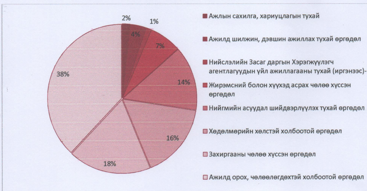
График 1. Өргөдлийг төрлөөр нь ангилсан байдал.

Өргөдөл гомдлын төрлийг нийт өргөдөлд эзэлж буй хувиар нь үзүүлбэл: