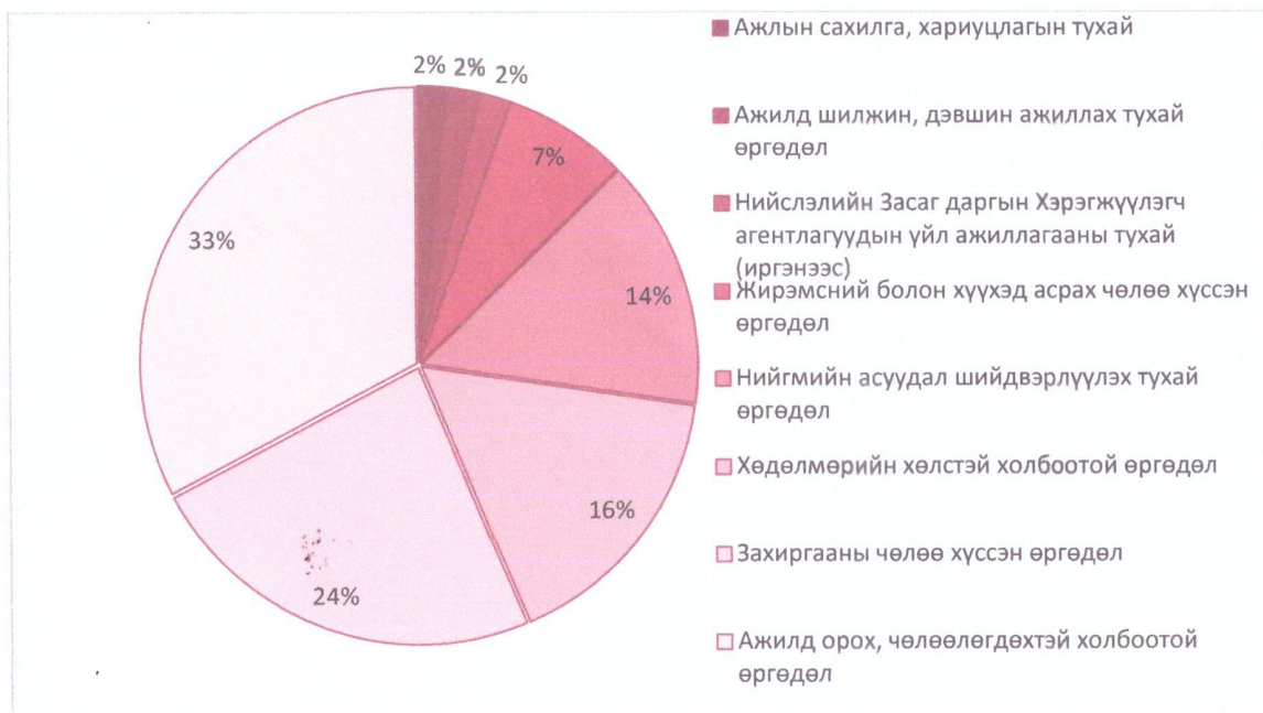
График 1. Өргөдлийг төрлөөр нь ангилсан байдал.

Өргөдөл гомдлын төрлийг нийт өргөдөлд эзэлж буй хувиар нь үзүүлбэл: