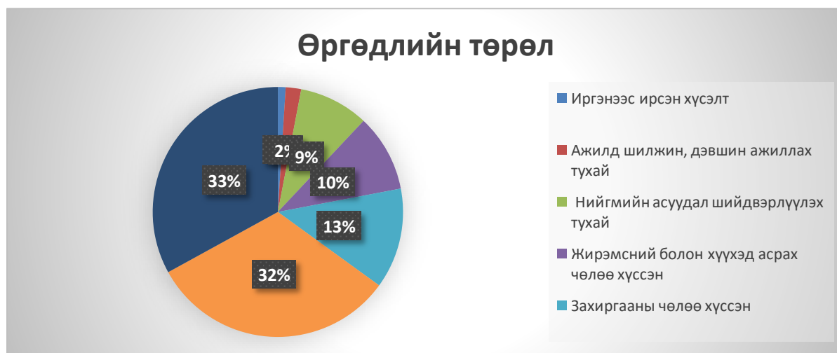
График 1. Өргөдлийг төрлөөр нь ангилсан байдал.

Өргөдөл гомдлын төрлийг нийт өргөдөлд эзэлж буй хувиар нь үзүүлбэл: