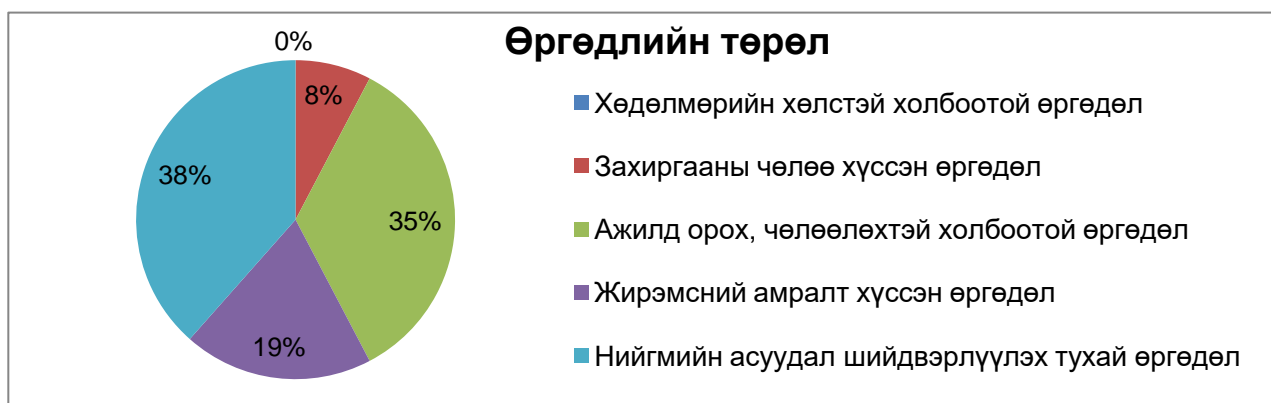
График 1: Өргөдлийг төрлөөр нь ангилсан байдал

Өргөдөл гомдлын төрлийг нийт өргөдөлд эзэлж буй хувиар нь үзүүлбэл: