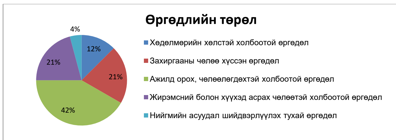
График 1: Өргөдлийг төрлөөр нь ангилсан байдал

Өргөдөл гомдлын төрлийг нийт өргөдөлд эзэлж буй хувиар нь үзүүлбэл: