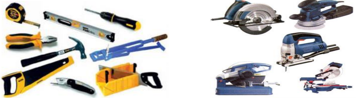
Зураг.№8. Ир сайтай, ирний хамгаалалт бүхий ажлын багаж

7.1.2 отвертка, бахь, хөрөө, сүх, харуул, цүүц /цахилгаан ба гар ажиллагаатай/ ирний хамгаалалттай байх;