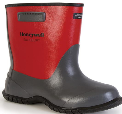
Зураг.№ 7. Тусгаарлагч резин гутал, резин шал шалны харагдах байдал

6.11.2 төмрийн хөрөө, хуурай, төмөр метр ашиглахгүй байх;