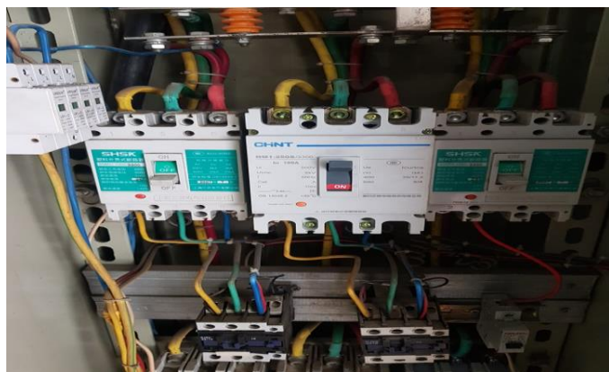
Зураг. №2. Цахилгааныг хүчдэлээс салгасны дараах харагдах байдал

6.2 Агуулах, номын сан, архивын өрөө зэрэг бичиг цаасны дэргэд цахилгаан техник, тоног төхөөрөмж ил тавьж ашиглах, засварлахгүй байх, цахилгаан шугамыг хамгаалах хэрэгсэлгүй угсрахгүй байх;