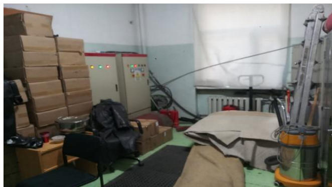
Зураг.№5. Цахилгааны щитны өрөөнд эд материал хурааж хадгалж болохгүй.

6.6 Цахилгаан дамжуулах утсыг тогтоох, сул татаж өлгөх, гар хийцийн гал хамгаалагч, зориулалтын бүрхүүлгүй уртасгагч, гэрлийг галын аюултай газруудад тавьж ашиглахгүй байх;