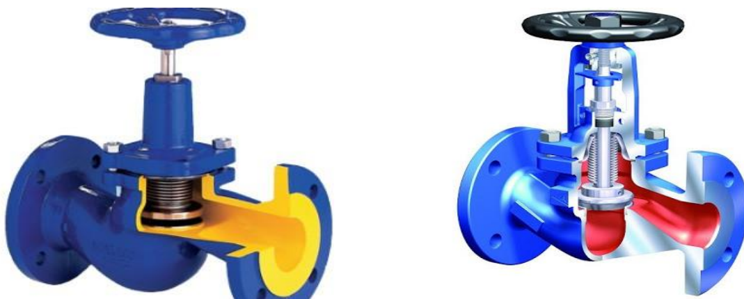
Зураг. №1. Халаалтын систем болон халуун хүйтэн усны хаалтуудын харагдах байдал

5.5 Халаалтын систем болон халуун хүйтэн усны системд үйлчилгээ хийхдээ төвийн гол шугамуудын хаалтуудыг бүрэн хааж ажиллах.