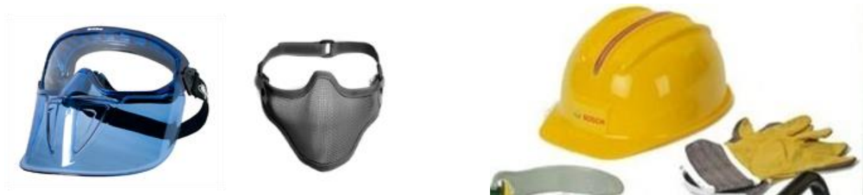
Зураг.№9. Хамгаалалт бүхий малгай, нүдний шил

7.1.3 шаардлагатай тохиолдолд хамгаалах малгай, ажлын бээлий өмсөх, нүдний хамгаалалтын шил зүүх;