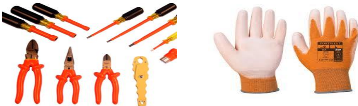
Зураг.№ 6. Ажлын шаардлага хангасан багаж, өндрийн зориулалт бүхий бээлий

6.8 Ажлын хамгаалах бээлий, хамгаалалттай багаж хэрэглэх;