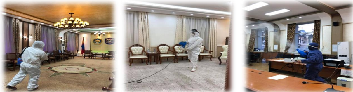
Зураг 29. Хурлын заал, уулзалтын өрөөний ариутгал, халдваргүйжүүлэлт