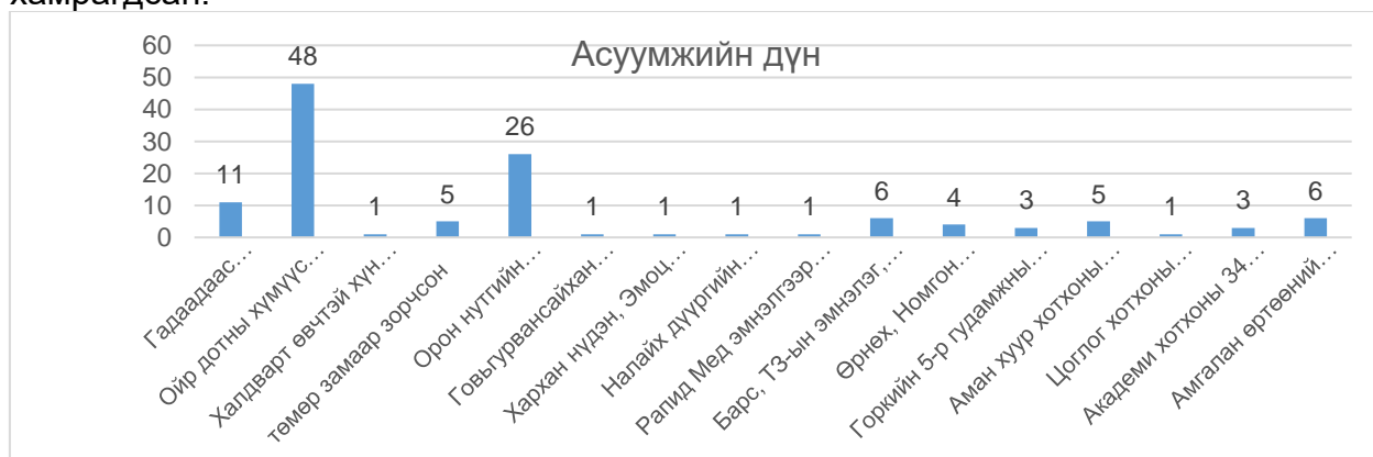
График 1. Ажилтан, албан хаагчдын халдвартай хүн асарсан, хавьтал болсон талаарх халдварын эрсдэл үнэлэх асуумж

Нийслэлийн Засаг даргын А/1280 “Гамшгаас хамгаалах бүх нийтийн бэлэн байдлын зэргийг бууруулсантай холбогдуулан хэрэгжүүлэх зарим арга хэмжээний тухай” захирамжийн хүрээнд нийслэлийн хэмжээнд хязгаарлалт тогтоохгүй үйл ажиллагаанд мөрдөх халдвар хамгааллын нийтлэг түр зааврыг мөрдлөг болгон ажиллаж нийслэлийн нутгийн захиргааны байруудад байрлах нийслэлийн харьяа байгууллагад ажиллаж буй ажилтан, албан хаагчдын халдвартай хүн асарсан, хавьтал болсон талаарх халдварын эрсдэлийг үнэлэх зорилгоор 2020 оны 12 дугаар сарын 14-18-ны хооронд 5 өдрийн хугацаанд “Асуумж судалгаа”-г www.erp.ulaanbaatar.mn/ авч дүнг нэгтгэсэн. Судалгаанд 847 албан хаагч хамрагдсан.