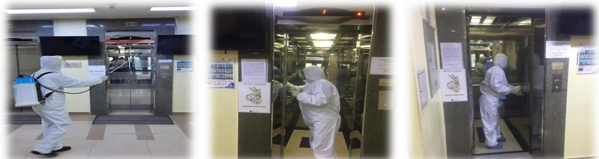
Зураг 23. Лифтны ариутгал, халдваргүйжүүлэлт

Байруудын ариун цэврийн ерөөний цэвэрлэгээ үйлчилгээг онцгойлон анхааран, ажлын ерөөний өдөр тутмын цэвэрлэгээ үйлчилгээний давтамжийг нэмэгдүүлж, гадна, дотор орчны нийт байруудын 41.636 м2 талбайд ариутгал, халдваргүйжүүлэлтийг 2 цаг тутам тогтмол хийж гүйцэтгэсэн. Мөн байр ашиглалтын албаны лифтчид НЗЗ-ны 2, 4-р байрны цахилгаан шатыг 1 цаг тутамд ариутган, хэвийн аюулгүй ажиллагааг бүрэн ханган ажилласан.