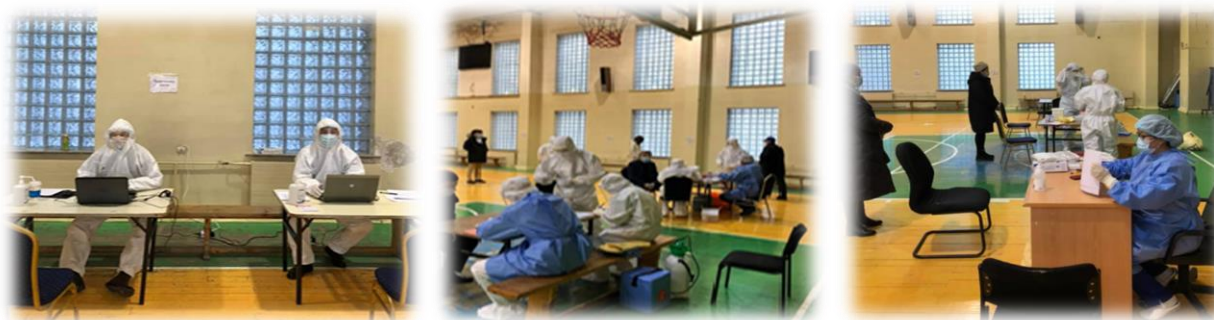
Зураг 27. Тус чэлленж хөдөлгөөний үед зохиогдсон арга хэмжээний үеэр

НЗДТГазраас НЗДТГазар, НИТХурлын ажилтан, албан хаагчдыг PCR шинжилгээнд хамруулах ажлыг зохион байгуулсан бөгөөд тус байгууллагаас нийт 5 албан хаагч бүртгэж, зохион байгуулалан ажиллаж, шинжилгээнд хамрагдсдын мэдээг нэгтгэн ХӨСҮТөвд өгч ажилласан. Байгууллагын нийт ажилтан, албан хаагчдыг өөрийн оршин суух дүүрэг, хороонд харьяаллын дагуу коронавирусийн PCR шинжилгээнд хамрагдах үүрэг өгсөн ба 2020 оны 12 дугаар сарын 18-ны өдрийн байдлаар 277 ажилтан, албан хаагч шинжилгээнд хамрагдсан.