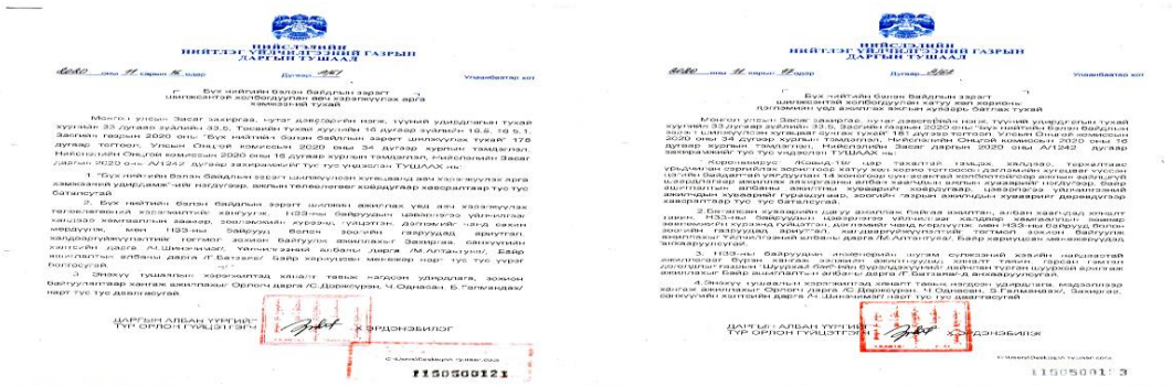
Зураг 17. Даргын тушаалын дагуу ажилтан, албан хаагчдын ажлын цагийн хуваарьт зохицуулалт хийн ажиллаж байна

НЗЗ-ны 1, 2 дугаар байруудад Нийслэлийн Онцгой комисс, нутгийн захиргааны зарим байгууллагуудын ажилтан, албан хаагчид ажиллаж байгаатай холбогдуулан коронавируст /Ковид-19/ цар тахлаас урьдчилан сэргийлэх, эрсдэлийг бууруулах чиглэлээр ажиллаж буй байгууллагын ажилтан, албан хаагчдыг хамгаалах хувцас, ариутгалын бодис хэрэглэлээр ханган ажилласан. Мөн тус байруудаас шаардлагатай хэрэгсэл, ариутгалын бодисны нэмэлт захиалгыг авч, нөөц бүрдүүлэлтийг хангаж ажилласан.