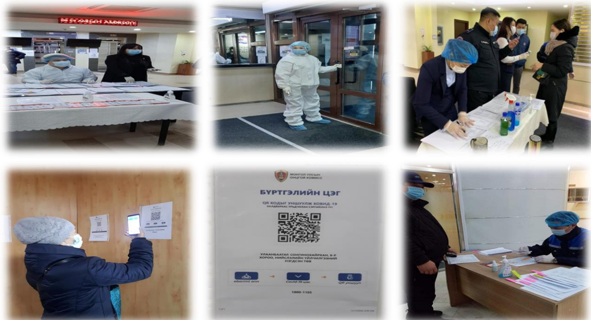
Зураг 21. Халдвар хамгааллыг сахин нэвтрүүлж буй үйл явцаас

Коронавируст /ковид-19/ цар тахалтай тэмцэх хариу арга хэмжээг хэрэгжүүлэх ажлын хүрээнд Нийслэлийн Засаг даргын шийдвэрээр нийслэлийн засаг захиргааны 1, 2 дугаар байруудад автомат халуун үзэгч, ариутгагч смарт хаалга байрлуулж нэвтрүүлдэг боллоо. Ингэснээр тус байруудад ажиллаж буй төрийн албан хаагчдыг нэвтрүүлэхэд бидний ажил үүргийг илүү хөнгөвчилсэн үр дүнтэй, түргэн шуурхай, найдвартай болж байгаа юм.