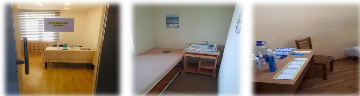
Зураг 24. Тусгаарлах өрөөг бэлэн болгосон байдал

Улсын Онцгой комиссын 2020 оны 12 дугаар сарын 19-ний өдрийн үүрэг чиглэлийн дагуу төрийн байгууллагад сэжигтэй тохиолдол илэрсэн үед ашиглах, тусгаарлах өрөөг 12 байршилд бэлтгэн коронавируст халдвар /Ковид-19/ цар тахлаас урьдчилан сэргийлэх хариу арга хэмжээг эрчимжүүлэн ажиллаж байна.