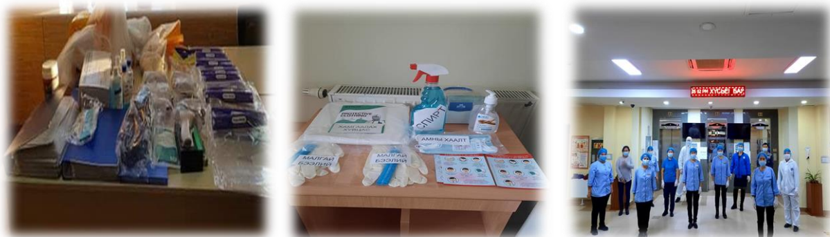
Зураг 2. Шаардлагатай хэрэгслэлийн нөөцлөлт

Шинэ коронавируст халдварт өвчнөөс урьдчилан сэргийлэх ажлын хүрээнд эм, эмнэлгийн хэрэгсэл, хамгаалах хувцас, ариутгалын бодисоор ханган, шаардлагатай нөөцийг бүрдүүлэн ажилласан.