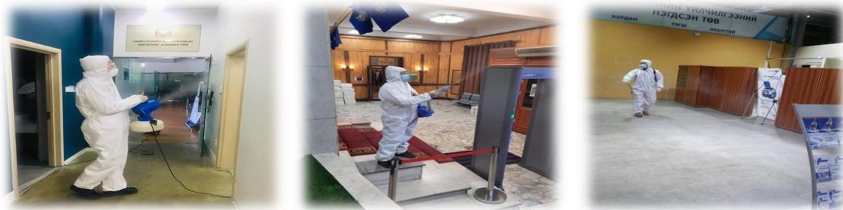
Зураг 28. Нийслэлийн Засаг захиргааны байруудад ариутгал, халдваргүйжүүлэлт хийж буй явцаас