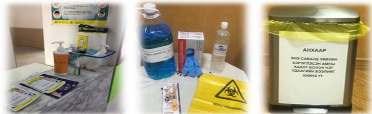
Зураг 7. Байруудад бэлэн байдлыг ханган ажиллаж буй байдал

Коронавирусын халдвараас ард иргэдийг хамгаалах зорилгоор НЗДаргаас өгсөн үүрэг чиглэл, хуваарийн дагуу байгууллагын 260 ажилтан, албан хаагч 02 дугаар сарын 20-ны өдрөөс 06 дугаар сарын 04-ний өдөр хүртэлх хугацаанд ХУД-ын 19 дүгээр хорооны нутаг дэвсгэрт “Эргүүл”-ийн албан үүргийг гүйцэтгэн 3844 аж ахуй нэгж, иргэдэд амны хаалт тогтмол зүүх талаарх ЭМЯамнаас өгсөн заавар зөвлөмжийг өгч, гарын авлага материалыг тараах, гудамж, олон нийтийн газраар сэлгүүцэхгүй байх зөвлөгөөг өгөн, аж ахуй нэгж байгууллагуудад ариутгал халдваргүйтгэл хийгдсэн эсэхэд хяналт тавин ажилласан. Тус хугацаанд тухайн нутаг дэвсгэрт гарсан ноцтой зөрчил байхгүй бөгөөд иргэд төр засгаас гаргасан шийдвэр, зөвлөгөөг хүндэтгэн эргүүлээр ажиллаж буй төрийн албан хаагчдын тавьсан шаардлагыг хүлээн авч амны хаалтаа тогтмол зүүж хэвшсэн. Эргүүлтэй холбоотой тайлан, мэдээг өдөр тутам ХУДүүргийн Онцгой комисст хүргэн ажилласан.