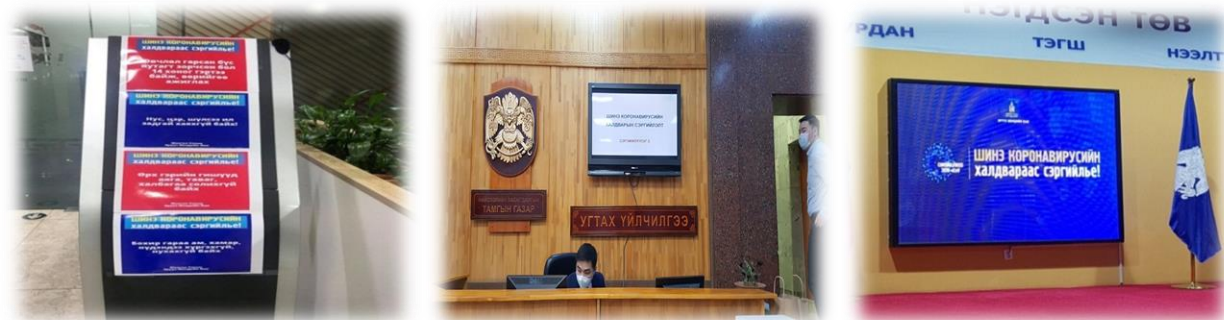
Зураг 4. Халдварт өвчнөөс урьдчилан сэргийлэх зөвлөмжийг ил тод байрлуулсан байдал

Нийслэлийн засаг захиргааны байруудын нийтийн эзэмшлийн талбай, ариун цэврийн өрөөнд гар ариутгагч спиртэн суурьт халдваргүйжүүлэлтийн уусмалыг байршуулан ажилласан бөгөөд халдвараас урьдчилан сэргийлэх цаасан зөвлөмжийг нийтийн эзэмшлийн талбайд ил тод байршуулан, урьдчилан сэргийлэх зөвлөгөөг видео хэлбэрээр дэлгэцээр тогтмол хүргэн ажилласан.