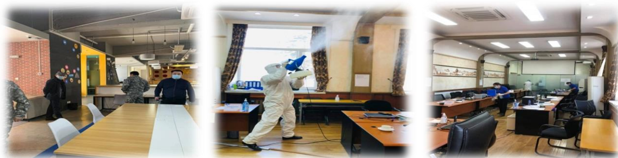
Зураг 30. НОКомиссын байрлаж буй өрөө, тасалгааны ариутгал, халдваргүйжүүлэлт