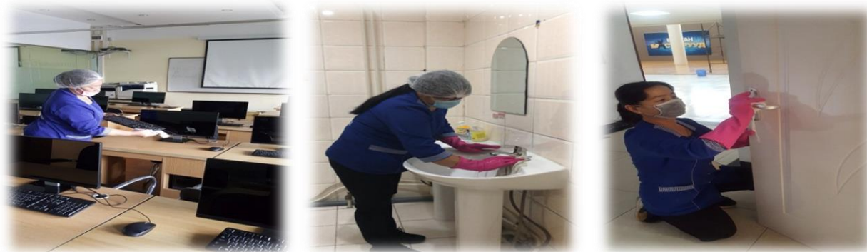
Зураг 5. Хувийн хамгааллыг ханган цэвэрлэгээ үйлчилгээг хийж буй явцаас

Байрууд гаднах орчны аюулгүй байдлыг хангах үүднээс байруудын гадна орчны нийт 2700м 2 талбайд 12 удаагийн давтамжтайгаар цэвэрлэгээ, үйлчилгээг хийж, ариутгал халдваргүйжүүлэлтийг хийлээ. Олон нийтийн газар нус, цэр, шүлсээ хаяхгүй, ил задгай хог хаягдлаар орчноо бохирдуулахгүй байх санамжийг тус тус байршуулж ажиллалаа.