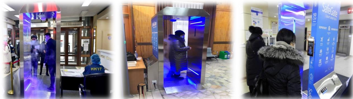
Зураг 22. Бүртгэл хөтлөн, халууныг хэмжин, смарт хаалгаар нэвтрүүлж буй явцаас

Коронавируст /ковид-19/ цар тахалтай тэмцэх хариу арга хэмжээг хэрэгжүүлэх ажлын хүрээнд Нийслэлийн Засаг даргын шийдвэрээр нийслэлийн засаг захиргааны 1, 2 дугаар байруудад автомат халуун үзэгч, ариутгагч смарт хаалга байрлуулж нэвтрүүлдэг боллоо. Ингэснээр тус байруудад ажиллаж буй төрийн албан хаагчдыг нэвтрүүлэхэд бидний ажил үүргийг илүү хөнгөвчилсэн үр дүнтэй, түргэн шуурхай, найдвартай болж байгаа юм.