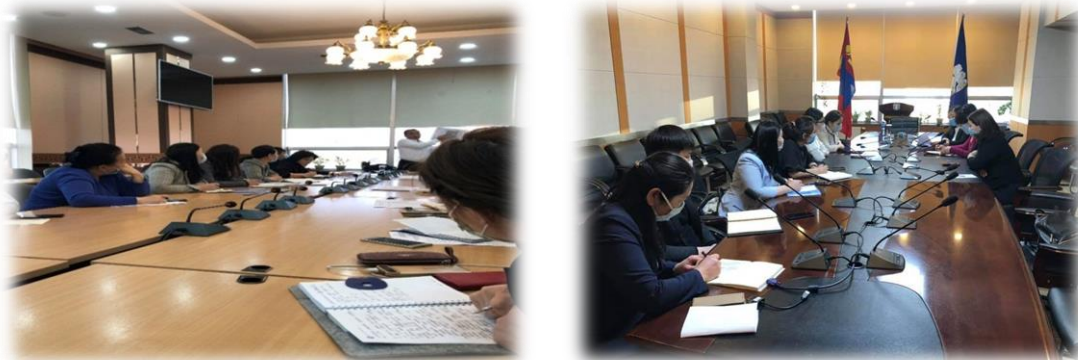
Зураг 1. Байр хариуцсан менежерүүдэд заавар, зөвлөгөө өгч буй байдал

2020 оны 02 дугаар сарын 19-ний өдрийн А/14 дүгээр тушаалын нэгдүгээр хавсралтаар “Өндөржүүлсэн бэлэн байдлын зэрэгт хэсэгчилсэн байдлаар шилжүүлсэн хугацаанд авч хэрэгжүүлэх арга хэмжээний удирдамж”, хоёрдугаар хавсралтаар “Нийслэлийн нийтлэг үйлчилгээний газраас шинэ коронавируст халдварт өвчнөөс урьдчилан сэргийлэх, бэлэн байдлыг хангах үйл ажиллагааны төлөвлөгөө”-г батлан холбогдох удирдлагад үүрэг чиглэл өгч, хариуцсан ажилтан, албан хаагчдаар төлөвлөгөөний хэрэгжилтийг хангуулан, хэрэгжилтэд хяналт тавих зэргээр удирдлага зохион байгуулалтаар ханган ажиллалаа.