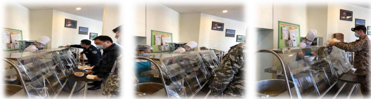
Зураг 25. НОК-ын ажилтан, албан хаагчдад хоол, цайгаар үйлчилж буй явцаас

Зоогийн газрын хүнсний бүтээгдэхүүний нийлүүлэлтийг гэрээт байгууллагатай хамтран баталгаат хүнсний бүтээгдэхүүнээр хангаж, тус хугацаанд хатуу хөл хорионы үед зөвхөн НЗДТГазрын зоогийн газар нь 5 хүний бүрэлдэхүүнтэйгээр Нийслэлийн Онцгой комиссын 120 хүний бүрэлдэхүүнд өдөрт 2 удаа хоол зоогийн үйлчилгээг халдвар, хамгааллын дэглэмийг чанд мөрдөн ажилласан.