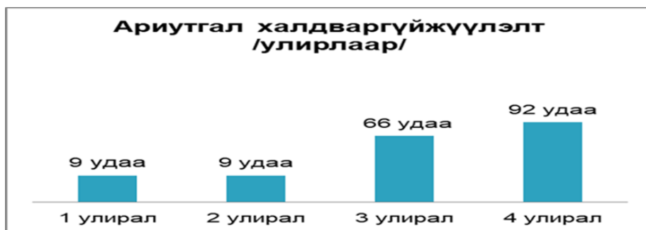
Зураг 32. Жилийн эцсийн байдлаар нийт 47,503,74 мкв талбайд ариутгал, халдваргүйжүүлэлт хийгдсэн