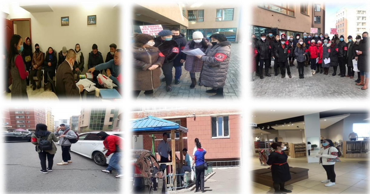
Зураг 8. Эргүүлээр ажиллаж буй байдал

Халдварт цар тахал дэгдсэнтэй холбогдуулан 2020 оны 03 дугаар сарын 23-ны өдрөөс эхлэн Өлзийт, Баянзүрхийн шалган нэвтрүүлэх товчоодод тус газрын 3 ажилтан 24 цагаар үүрэг гүйцэтгэн ажилласан.