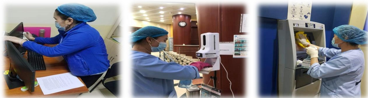
Зураг 26. Цэвэрлэгээ үйлчилгээ хийж буй явцаас

Байруудын ариун цэврийн өрөөний цэвэрлэгээ үйлчилгээг онцгойлон анхааран, ажлын өрөөний өдөр тутмын цэвэрлэгээ үйлчилгээний давтамжийг нэмэгдүүлж, гадна, дотор орчны нийт байруудын 41.636 м2 талбайд ариутгал, халдваргүйжүүлэлтийг 2 цаг тутам тогтмол хийж гүйцэтгэсэн.