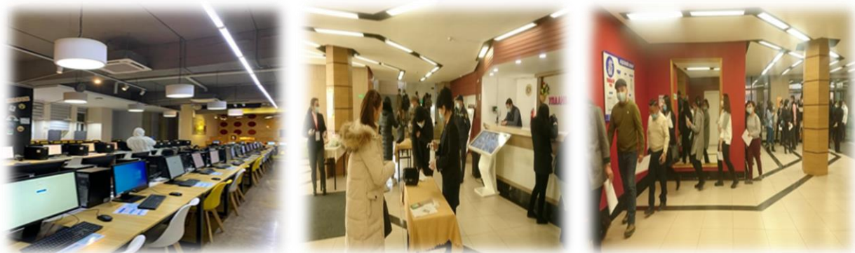
Зураг 16. Төрийн албаны шалгалтын үеэр