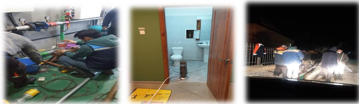
Зураг 19. Шуурхай багийн үйл ажиллагааны явцаас

Тухайлбал хатуу хөл хорионы үед Баянхошуу дэд төвийн усны хэрэглээ зогссонтой холбоотойгоор хэрэглээний хүйтэн усны гадна шугам худгаас барилга хүртэлх 16 метр зайд хөлдөж, хэрэглээний халуун, хүйтэн усны дотор шугам ариун цэврийн өрөөний хананд байрлах шахтын хөндийд PPR Ф15 диаметртай босоо шугам хоолой хөлдсөнийг 2020 оны 11 дүгээр сарын 21-нээс 22-ны шилжих шөнө Байр ашиглалтын албаны “Гамшгаас хамгаалах шуурхай баг” 9 хүний бүрэлдэхүүнтэйгээр очиж, уураар халааж хөлдөнгийг гэсгээж, хэрэглээний халуун, хүйтэн усны шугамыг хэвийн үйл ажиллагаанд оруулан ажилласан.