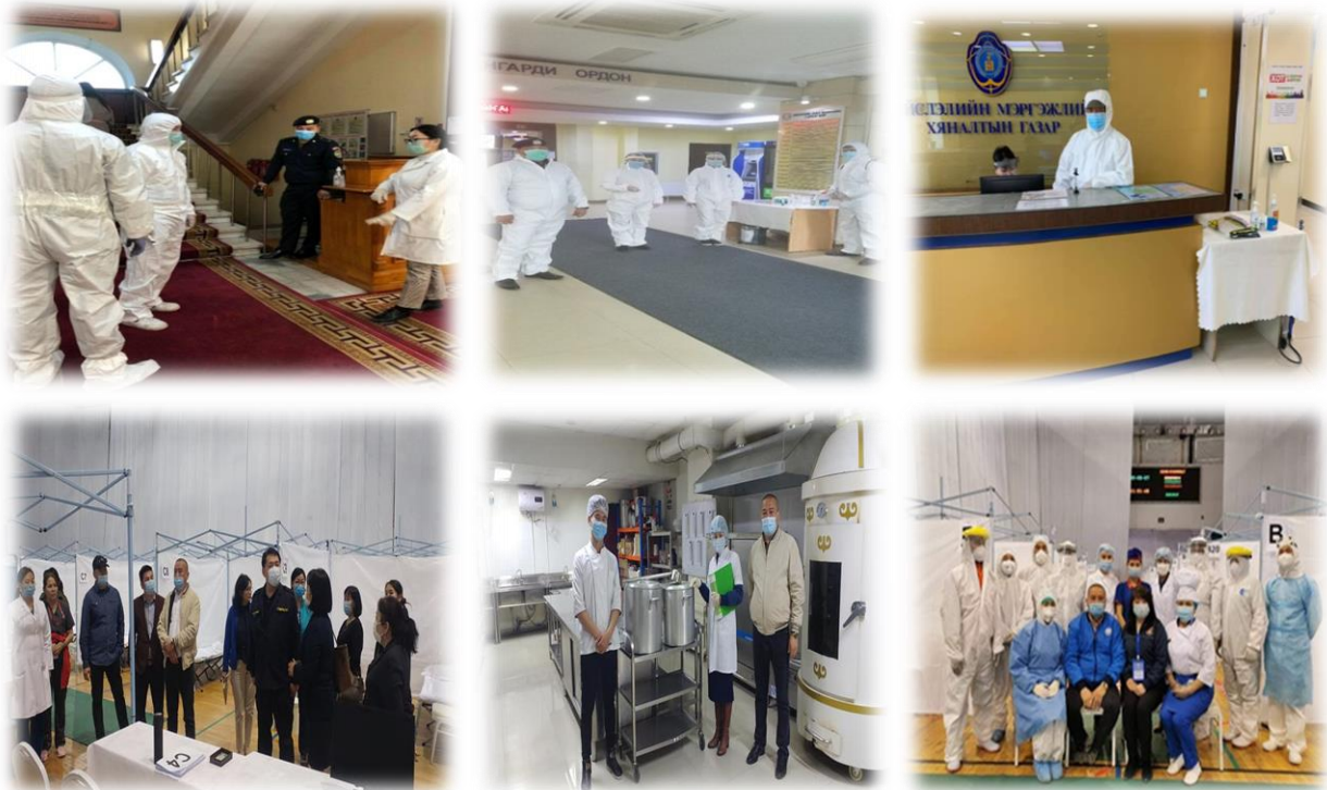
Зураг 11. Сургуулилтын үеэр өндөржүүлсэн бэлэн байдлаар ажиллаж буй байдал

“Ковид-19 халдварт цар тахлын үеийн харилцан ажиллагаа, хариу арга хэмжээ” сэдэвт дадлага сургуулилт 2020 оны 05 дугаар сарын 07-ны өдөр Чингэлтэй дүүргийн нутаг дэвсгэрт зохион байгуулагдаж, НЗЗ-ны 4-н байранд өндөржүүлсэн бэлэн байдлын тусгай хувцас хэрэглэлийг өмссөн 13 ажилтан орох, гарах хөдөлгөөнийг бүрэн хязгаарлах арга хэмжээг авч, хөл хорионы дэглэмийг сахиулан ажиллалаа.