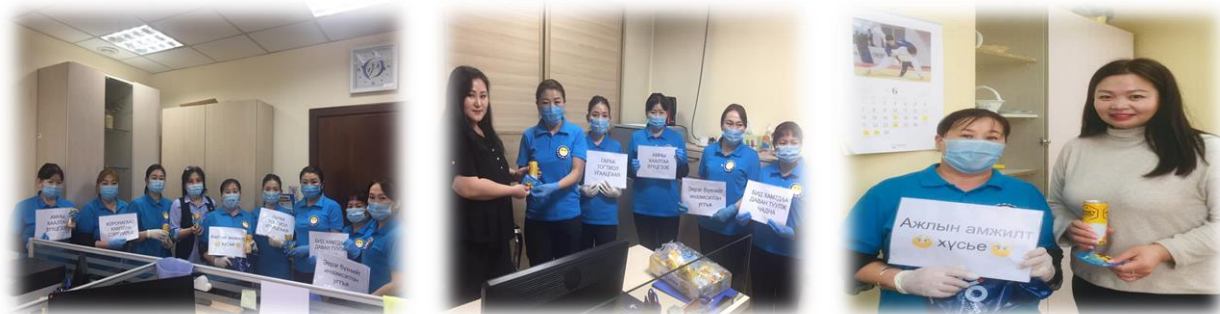
Зураг 12. Витаминжуулалт хийж буй байдал

НЗЗ-ны 2 дугаар байрны үйлчилгээний ажилтнуудыг санаачилгаар “Эх үрсийн баяр”-ыг тохиолдуулан байгууллагын ажилтан, албан хаагчдын дархлааг дэмжих зорилгоор витаминжуулалтын ажлыг зохион байгуулсан.