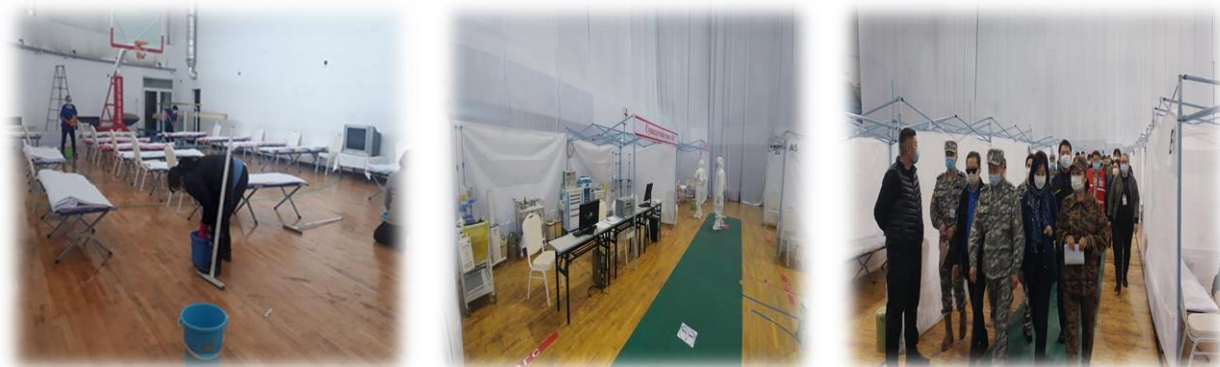
Зураг 10. Халдварт цар тахлын үед ажиллахад зориулагдсан 300 ортой эмнэлгийн бэлтгэл ажлыг ханган удирдлагуудад хүлээлгэн өгч буй үе

“Ковид-19 халдварт цар тахлын үеийн харилцан ажиллагаа, хариу арга хэмжээ” сэдэвт дадлага сургуулилт 2020 оны 05 дугаар сарын 07-ны өдөр Чингэлтэй дүүргийн нутаг дэвсгэрт зохион байгуулагдаж, НЗЗ-ны 4-н байранд өндөржүүлсэн бэлэн байдлын тусгай хувцас хэрэглэлийг өмссөн 13 ажилтан орох, гарах хөдөлгөөнийг бүрэн хязгаарлах арга хэмжээг авч, хөл хорионы дэглэмийг сахиулан ажиллалаа.