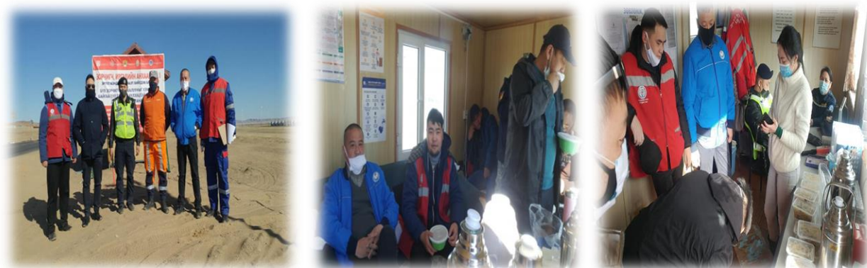
Зураг 9. Шалган нэвтрүүлэх товчоонд ажиллаж буй төрийн албан хаагчдад хоол цайгаар үйлчиллээ

Халдварт цар тахал дэгдсэнтэй холбогдуулан 2020 оны 03 дугаар сарын 23-ны өдрөөс эхлэн Өлзийт, Баянзүрхийн шалган нэвтрүүлэх товчоодод тус газрын 3 ажилтан 24 цагаар үүрэг гүйцэтгэн ажилласан.