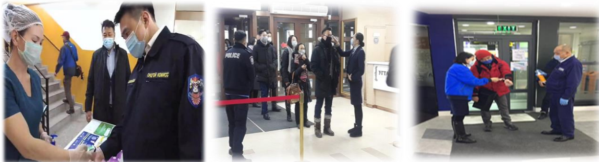
Зураг 3. Халууныг тогтмол хэмжин, гар ариутгагч хэрэглүүлж нэвтрүүлж буй явц

Нийслэлийн нийтлэг үйлчилгээний газар нь шинэкоронавируст халдварт өвчнөөс урьдчилан сэргийлэх зорилгоор нийслэлийн засаг захиргааны 5-н байр, нийслэлийн үйлчилгээний нэгдсэн төвийн 4-н салбар болон Баянхошуу дэд төвийн байруудад ажиллаж буй төрийн албан хаагчид, үйлчилгээ авч буй иргэдэд тогтмол амны хаалт зүүх шаардлага тавьж, зөвхөн амны хаалт зүүсэн төрийн албан хаагч, иргэдийн халууныг хэмжин, гар ариутгагч спиртэн суурьт халдваргүйжүүлэлтийн уусмалаар гарыг ариутган нэвтрүүлэх ажлыг зохион байгуулан бүрэн хэвшүүлэн ажилласан.