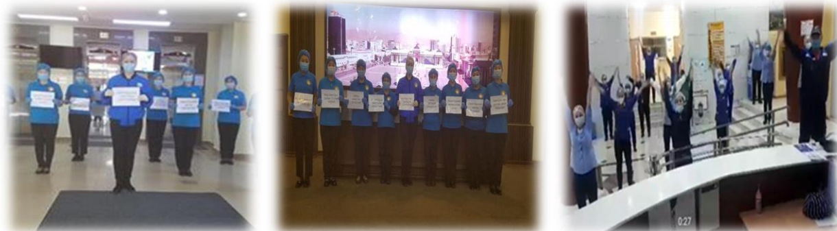
Зураг 13. Тус чэлленж хөдөлгөөний үед зохиогдсон арга хэмжээний үеэр

Монгол Улсын Шадар сайд, Улсын онцгой комиссын даргын баталсан “Амны хаалтаа зүүцгээе” аяны хүрээнд цаг үеийн нөхцөл байдалтай уялдуулан “Амны хаалт-Таны баталгаа” чэлленж хөдөлгөөнийг өрнүүлэн НЗЗ-ны байруудад үйл ажиллагаа явуулдаг төрийн албан хаагч нарыг уриалан видео хэлбэрээр уриалга гарган олон нийтийн сүлжээнд байршуулан ажилласан. Тус тайланг 2020 оны 06 дугаар сарын 04-ний өдөр НЗДТГ-т хүргүүлсэн.