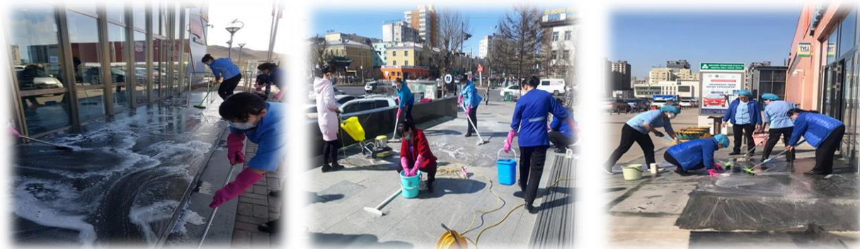
Зураг 6. Байруудын гадна талбайд цэвэрлэгээ үйлчилгээг хийж буй байдал

Байрууд гаднах орчны аюулгүй байдлыг хангах үүднээс байруудын гадна орчны нийт 2700м 2 талбайд 12 удаагийн давтамжтайгаар цэвэрлэгээ, үйлчилгээг хийж, ариутгал халдваргүйжүүлэлтийг хийлээ. Олон нийтийн газар нус, цэр, шүлсээ хаяхгүй, ил задгай хог хаягдлаар орчноо бохирдуулахгүй байх санамжийг тус тус байршуулж ажиллалаа.