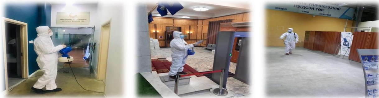
Зураг 15. Нийслэлийн Засаг захиргааны байруудад ариутгал, халдваргүйжүүлэлт хийж буй явцаас