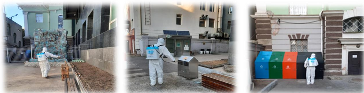
Зураг 31. Байруудын гадна талбайн ариутгал, халдваргүйжүүлэлт