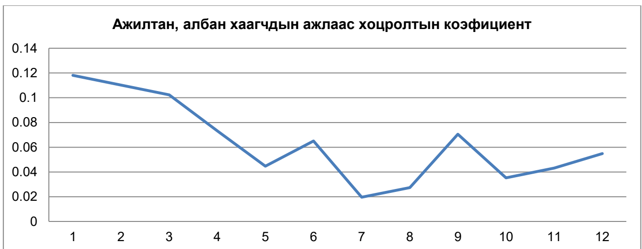
График 2. Ажлаас хоцролт, эрт гаралтын коэффициент