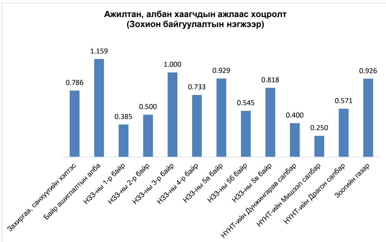
График 3. Цаг ашиглалт /Зохион байгуулалтын нэгжээр/

Графикаас харахад 2019 онд цаг ашиглалт хамгийн сайн байгаа нэгж НҮНТ-ийн Мишээл салбар, Дүнжингарав салбар, НЗЗ-ны 1-р байр байгаа бөгөөд цаг ашиглалтаар хамгийн хангалтгүй байгаа нь байр ашиглалтын алба, НЗЗ-ны 3-р байр байна.